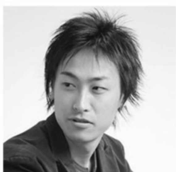
磯部 俊哉 作曲