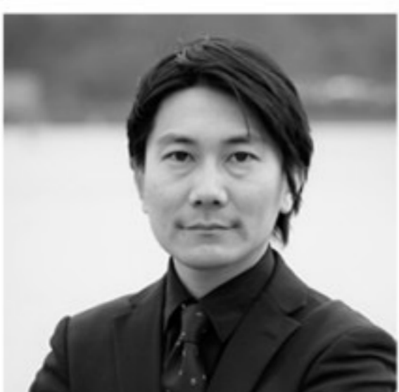
川上 統 作曲