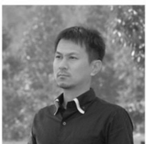
徳永 崇 作曲