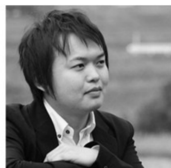
奥野 隆 ギター

個人として京都音楽賞(実践部門)、中島健蔵賞、朝日現代音楽賞を受賞。またアンサンブル・ノマドとして佐治敬三賞、ウィーンフィル&サントリー音楽復興記念賞を受賞。