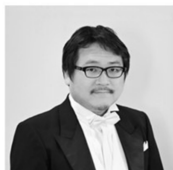
田尻 健 テノール