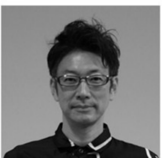
寺内 大輔 作曲